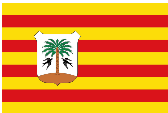
Disseny de bandera com a suport de l'escut